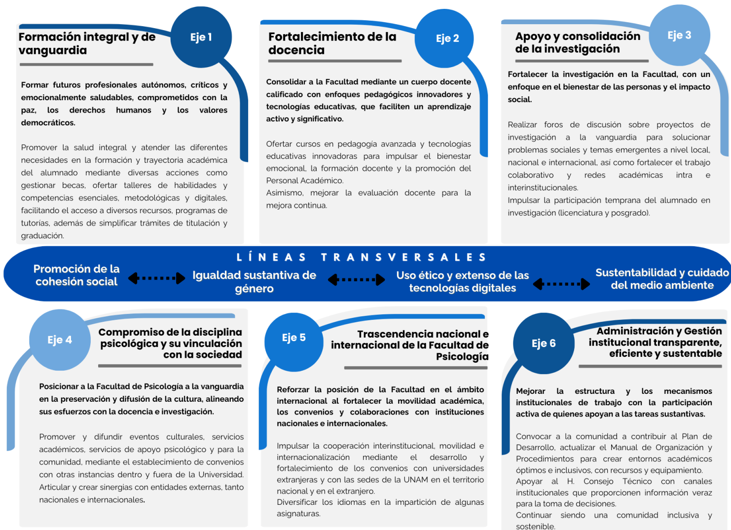
Síntesis de los Ejes del Plan de Trabajo, Líneas Transversales y Acciones